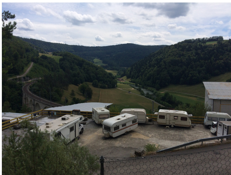
Logements des artistes en dessus de l'usine

Artistes ponctuels : 25 (de Suisse et d'Italie.)