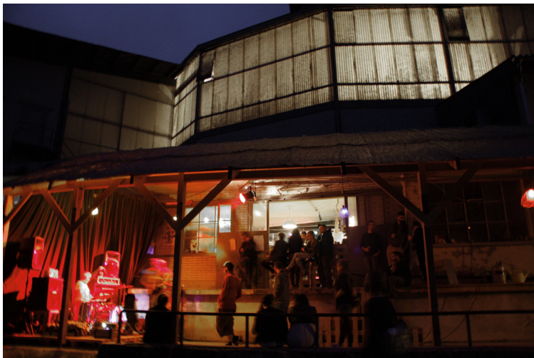
Concert de Lafopaes, soirée du 14 août