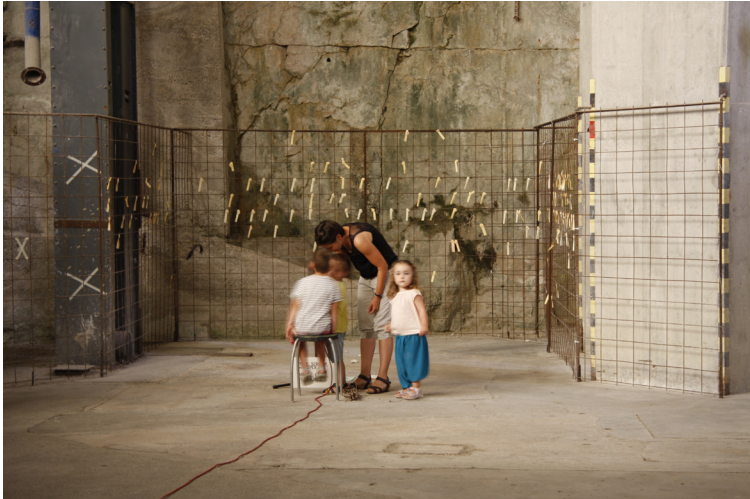
Atelier d'expérimentations sonores