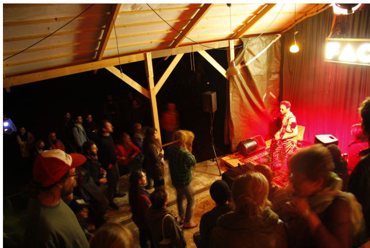
Concert de Syndrome WPW, soirée du 1 er août

Cela dit, il importe de préciser encore qu'après bilans, réflexions et investigations, nous nous rendons compte que la formule hors norme proposée aux FAC 2015 n'a pas d'égale en Suisse et peut-être même en Europe, qu'elle représente une réflexion d'avant-garde et une vision d'avenir, tant culturelle et sociale qu'artistique. Outre la philosophie du projet, le site des fours-à-chaux et ses environs offre d'innombrables possibilités, notamment par son esthétique, son histoire et l'imaginaire qu'il crée, par la cohabitation harmonieuse avec l'équipe de Swiss Topo/ Mont Terri Projet, la proximité avec la nature et la ville de St-Ursanne et ses habitants avec qui nous avons eu des échanges riches, etc.